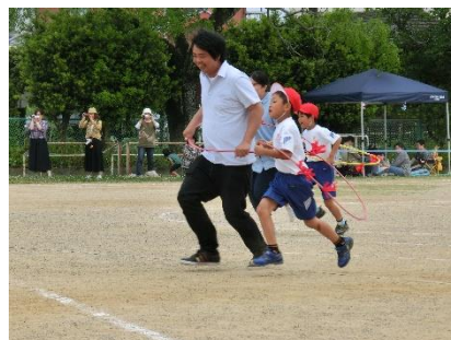
昨年度の運動会の様子

保護者の皆様や地域の皆様の応援場所は、児童の活動の妨げにならないところでお願いします。徒競走のゴール付近、子どもたちの入退場付近ではレジャーシート等を置かないようにお願いします。このことにつきましては別途お知らせの文書を出しています。運動会の運営、進行にも御協力をお願いします。