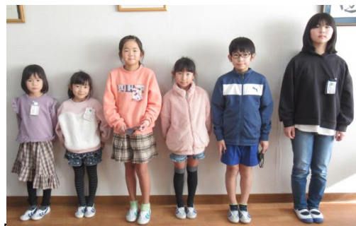
終業式で発表した代表児童のみなさん

いよいよ明日から10日間の冬休みです。でも、外出はできるだけ控え、今までの生活を振り返りながら新しい年に向けた準備をすすめましょう。そのために心がけてほしいことを2つ話します。